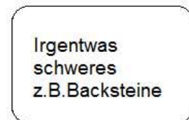
Irgentwas schweres z.B. Backsteine

1. Von dem (kleinen, ca. 14x14 cm. großen) Pappkarton schneiden wir zuerst den "Verschluss" ab. (rot markiert)